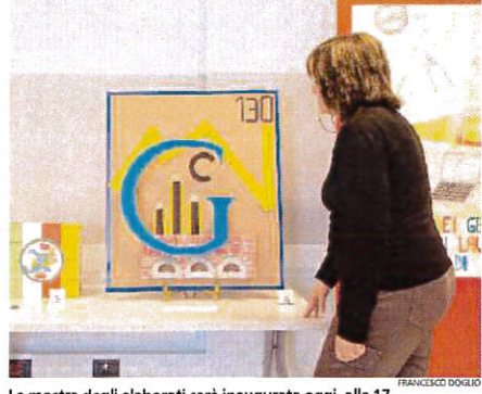
La mostra degli elaborati sarà inaugurata oggi, alle 17