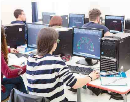
Studenti impegnati ieri mattina nella progettazione

Sempre ieri, alle 18, al teatro Toselli, c'è stata la premiazione del miglior logo (realizzato dagli studenti delle Medie)